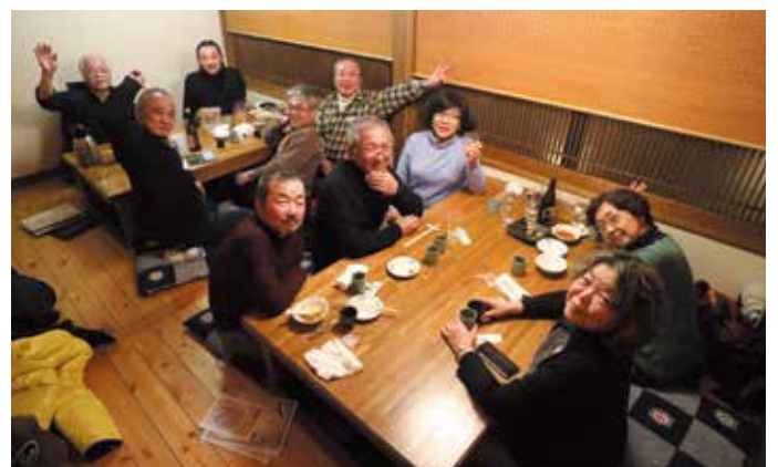
飲んで食べて笑って満足！