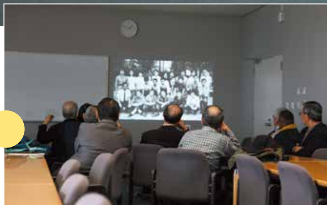
総会：DVD を観る～ 懐かしいとの声続々