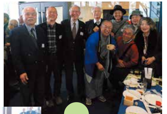
春風亭柳橋師匠と