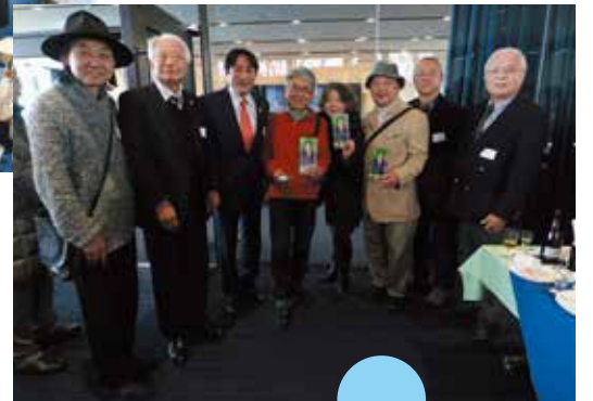
同窓生の川田龍平 参議院議員と