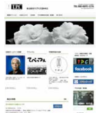
テスト版HPの トップページ