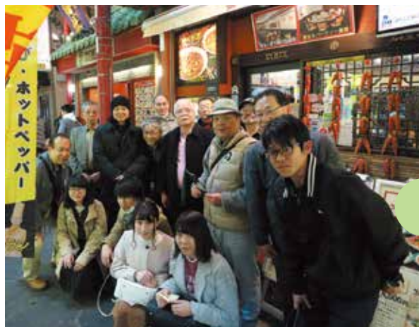
新年会 横浜中華街にて