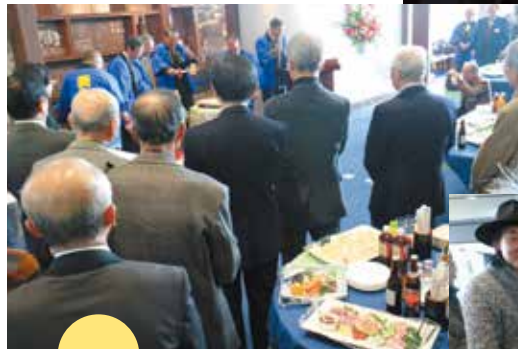
午餐会：威勢良く鏡割