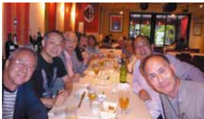
これはシワ伸ばし加工済の写真です。よくみてください。皆若いです。(技術担当 荒川)