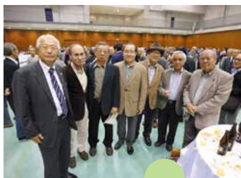
地方から駆け付けた方も